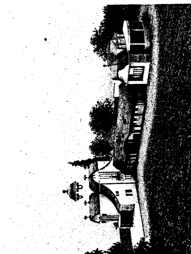
Wereldtentoonstellingen (hier vlnr. het Duitse paviljoen, een replica van het Delunehuis aan de toenmalige Natiënlaan, en het Belgisch paviljoen) worden nooit voor de eeuwigheid gebouwd. ULB-maquettes uit 2010.