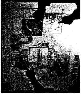
Digitaal bladeren en touchscreens: hightech ULB-tentoonstelling.

attractief voor jong en oud. Neem nu het virtuele 'programmaboek' - digitaal en taatsbaar tegelijk - waarin je kunt bladeren om driedimensionale foto's geprojecteerd te krijgen. Over de Europese paviljoenen: Duitsland, Frankrijk, Spanje, Italië, Nederland, Monaco en Groot-Brittannië. Over België: Over de Amerikas; de VS, Canada, Brazilië. Over Azië, Congo en de Franse kolonies. En ten slotte over 'De menselijke diertentoon', meteen in de buurt van het Paleis van de Vrouwenaarheid... In enkele van die paviljoenen kun je ook fysiek binnenstappen, als je even voor het green screen (een variant op het blue screen van de tv-weerman) plaatsneemt.