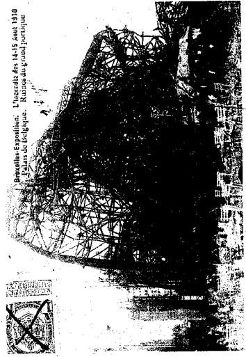
Brusselles-Espalioles. L'iccedite des 1415 deat 1810 de 1910 de Belgique. Brusselles gend paviljoen