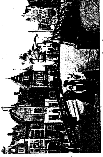
Op 14 en 15 augustus 1910 legde een zware brand een groot deel van de Wereldtentoonstelling in de as, onder meer het prepark Brusselles Kermesse ging in vlammen op. Razendsnel werd het heropgebouwd.