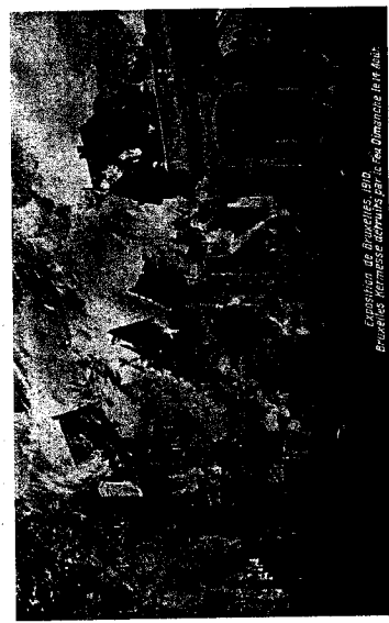
Expositie in Brusselles 1910 Brusselles Kermesse doorvlns par la feu d'embrase de 1910